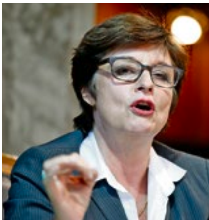
SP-Ständerätin Anita Fetz.

Damals habe ich mich noch nicht wirklich für Politik interessiert und der Entscheid ist an mir vorbeigegangen. Aber als es 1971 auf